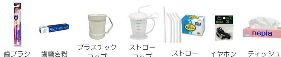
歯ブラシ 歯磨き粉 プラスチックコップ ストローコップ ストロー イヤホン ティッシュ