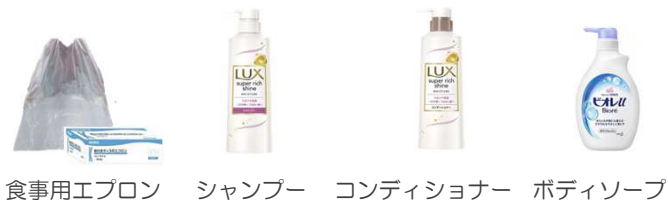
食食用エプロン シャンプー コンディショナー ボディソープ