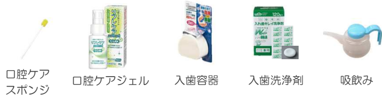
口腔ケアスポンジ 口腔ケアジェル 入歯容器 入歯洗浄剤 吸飲み