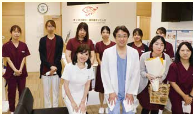
受付の前でスタッフと